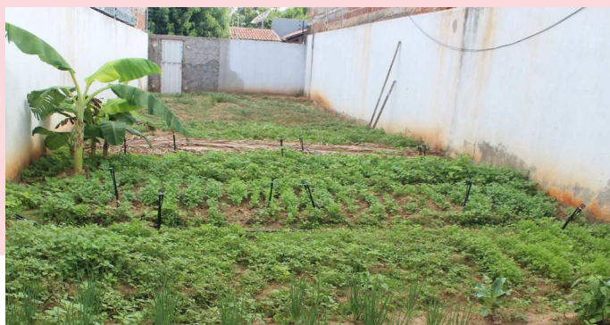
Começou o cultivo da horta

As comunidades mais desfavorecidas do Brasil comem frequentemente poucas quantidades de alimentos saudáveis porque não têm acesso a vegetais frescos ou produtos saudáveis vendidos nas lojas locais. Uma das nossas novas iniciativas é uma horta no nosso centro de Patos que ajuda as crianças a aprender como as plantas são cultivadas e como os alimentos são produzidos. Isso os ajuda a aprender sobre a importância de cuidar do meio ambiente, necessário para a vida no planeta, bem como sobre a importância de uma dieta saudável. As crianças participam de todo o processo: desde a seleção dos cultivos até à plantação, cuidado e colheita dos mesmos. Aprendem quais alimentos podem ser produzidos a partir de cada cultura e desfrutarão das refeições que serão preparadas com o que foi colhido. Como bônus, os custos dos alimentos serão reduzidos. Estamos satisfeitos porque o solo já ficou pronto.