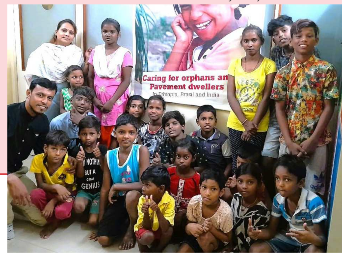
Nossas crianças e jovens de Calcutá

O nosso grupo alvo na Índia são principalmente crianças que vivem nas ruas de Calcutá nas circunstâncias mais difíceis, especialmente em tempos de insegurança, como vimos nestes últimos anos. Além do nosso investimento no futuro destas jovens vidas, acreditamos ser especialmente importante para as crianças vulneráveis e traumatizadas obter uma base segura para a vida. No verão passado, as 70 crianças atendidas pela Operação Resgate conseguiram compreender algumas verdades bíblicas e experimentar a boa nova de Jesus através de várias abordagens, inclusive através do jogo. Jogos de interior, músicas, jogos de trivia e concursos de desenho permitiram-lhes desfrutar uns com os outros, desenvolver amizades e elos com nosso pessoal, divertir-se e apreciar alguma refeição especial: frango, suco de fruta, bolo e mais. Foi verdadeiramente uma celebração maravilhosa.