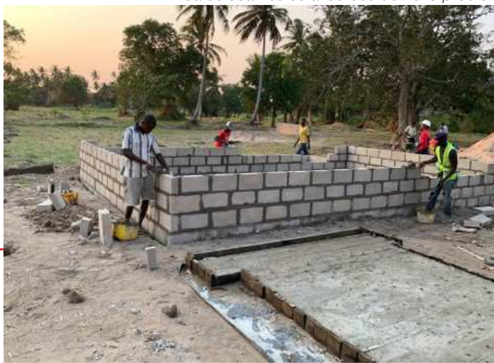
Já colocamos os alicerces do novo prédio!

Faça uma doação na nossa página web para ajudar na construção do novo centro.