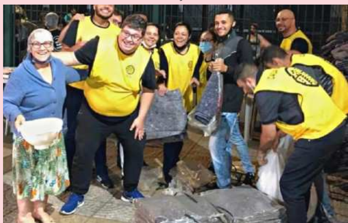
Distribuição de cobertores em São Paulo

Na enorme metrópole de São Paulo, onde o inverno é rigoroso em comparação com as zonas mais quentes do país, as pessoas em situação de rua podem morrer não só de fome, mas também de frio. A Operação Resgate está lá a ajudar a satisfazer as necessidades básicas deles. Há pouco doamos 100 cobertores, meias e gorros a uma organização parceira chamada Acolhe Mais Um, um projeto que cuida de grupos vulneráveis que vivem nas ruas, oferecendo cobertores, suprimentos para o inverno além de uma mensagem de apoio moral.