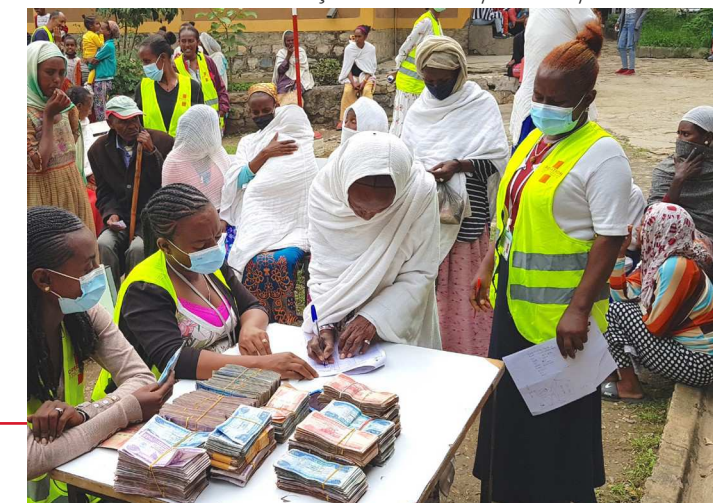
Distribuição de dinheiro para comprar alimentos

O cessar-fogo entre as partes beligerantes, anunciado no início de novembro, torna-nos otimistas, mesmo que com cautela, de que este frágil processo de paz não será novamente perturbado. Segundo Getachew, apesar da falta de um cessar-fogo melhor, parece que pode haver uma mudança positiva.